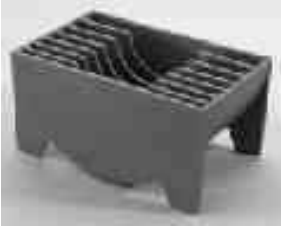
36 130 00 FOLIENBOX / FOIL DISPENCER für 7 Rollen mit unterschiedlichen Breiten for 7 rolls with different sizes