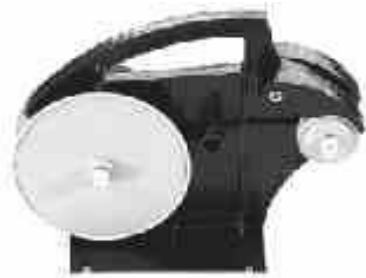
36 140 00 FOLIENANROLLER / FOILER GLASTAR