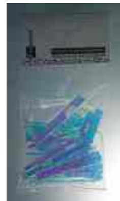
35 396 01 Dichroic Bruch Dichroic in pieces auf transparent on transparent 100g, 1,5 mm