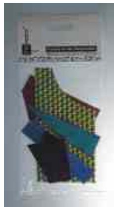
35 396 02 Dichroic Bruch Dichroic in pieces auf schwarz on black 100g, 1,5 mm