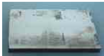
Palladiumbeschichtete Glastafeln, 3 mm Palladium coated glass sheets, 3 mm 35 391 00 26 x 30 cm (Float) 35 393 00 20 x 30 cm (Artista)