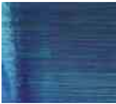
35 347 xx gekämmt / fibroid