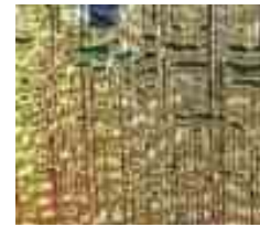
35 345 xx Rippel gekämmt