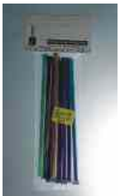
35 397 01 Dichroic Stäbe / Rods auf schwarz on black 10 Stck./pcs, 19 cm