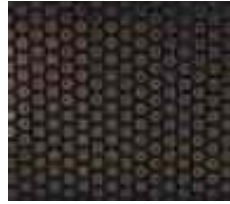
35 357 xx Punkte / Dots