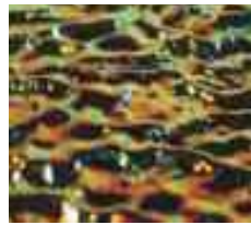
35 342 xx Ripple