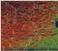
35 346 xx Granite