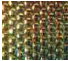
35 348 xx genoppt / Radium