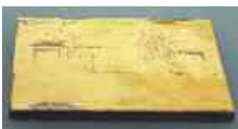
Goldbeschichtete Glastafeln, 3 mm Gold coated glass sheets, 3 mm 35 390 00 26 x 30 cm (Float) 35 392 00 20 x 30 cm (Artista)